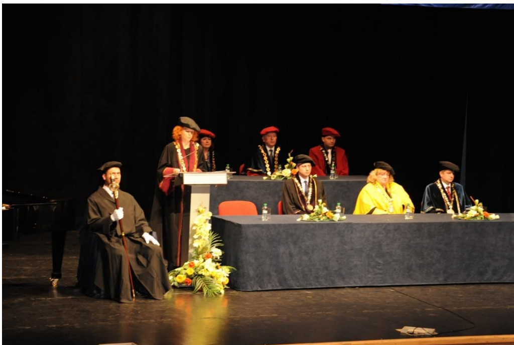
Vedenie VŠD – rektor, prorektorka a dekani a prodekan fakúlt