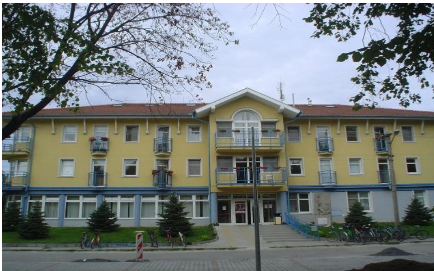
Tolerancia, n.o. ŠPECIALIZOVANÉ VÝUČBOVÉ PRACOVISKO FSŠ VŠD

Výučba vybraných predmetov sociálnej práce si nevyhnutne vyžaduje prepojenie s praxou za účelom aplikovaného výskumu, edukácie študentov ako aj výučby vybraných predmetov študijného programu „Sociálna práca“. http://www.toleranciano.sk/ .