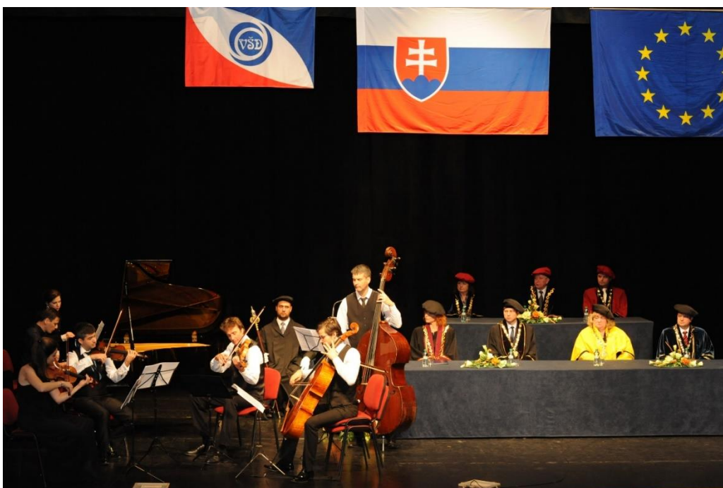
Vystúpenie skupiny QUASARS ENSEMBLE v rámci kultúrneho programu